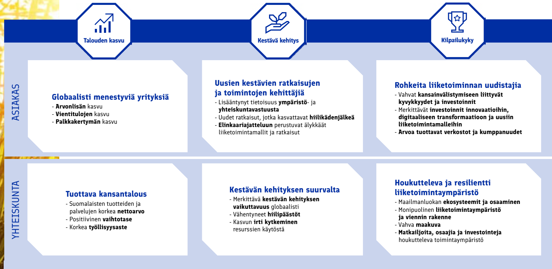
Kuva 3: Business Finlandin vaikuttavuustavoitteet