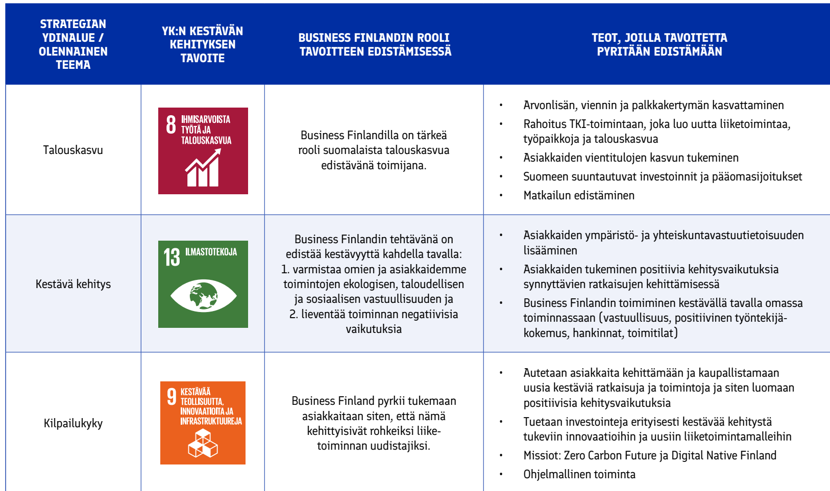
Taulukko 11: Business Finlandin strategian ydinalueet ja YK:n kestävän kehityksen tavoitteet. 9