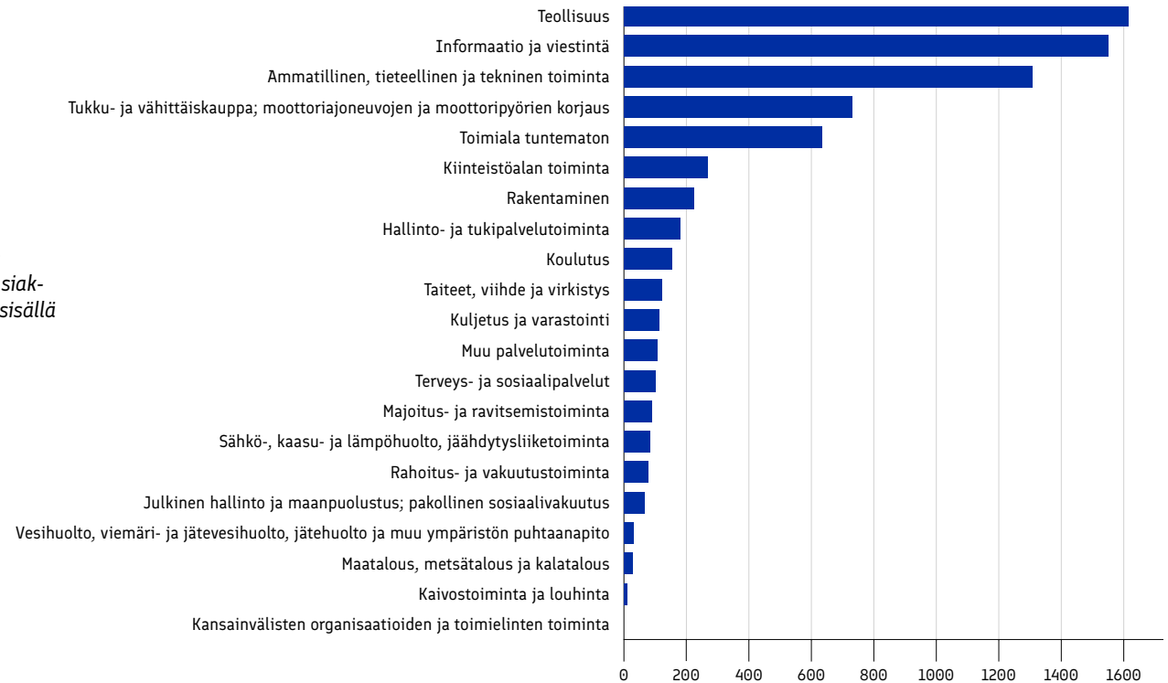
Kuva 1: Business Finlandin Suomessa toimivat yritysasiakkaat päätoimialoittain (ei sisällä häiriörahoitusasiakkaita)